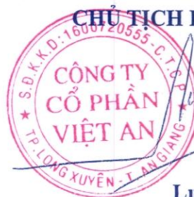
Lưu Bách Thảo